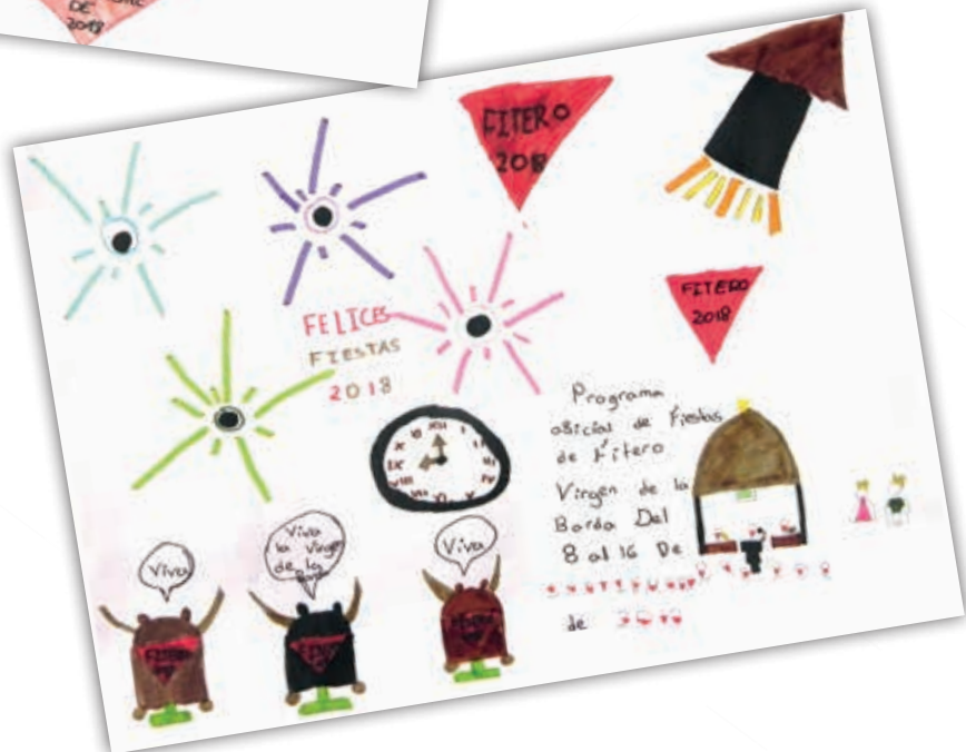
Blanca Jiménez. 2 o Premio Infantil Concurso Carteles 2018